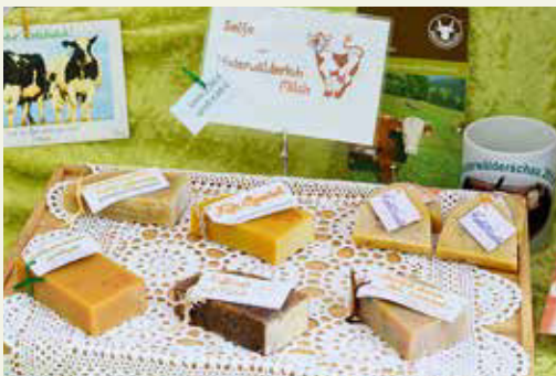
Aus der Milch der Hinterwälder werden auch Seifen hergestellt und vom Förderverein vertrieben.